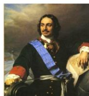
«ПЁТР I – ПЕРВЫЙ РОССИЙСКИЙ ИМПЕРАТОР»

помогла России море. Благодаря стала великой морской могущественных в мире. говорить о неустомимом и свою деятельность на «Великий». Узнаем, что страны?