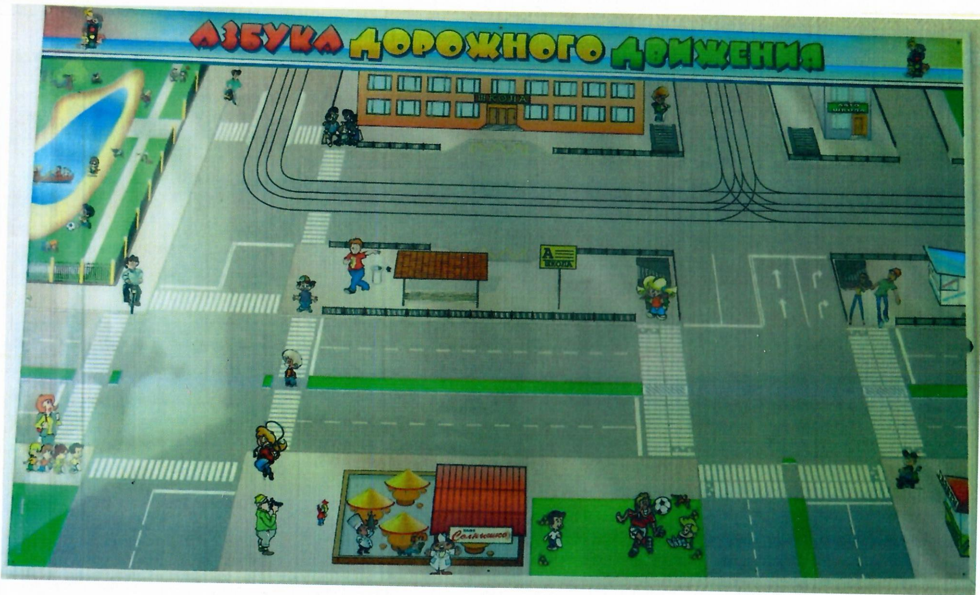
Уголок ПДД (холл, 1 этаж)